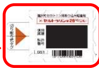
<セルトラリン錠 個装箱と切り取りタグ>