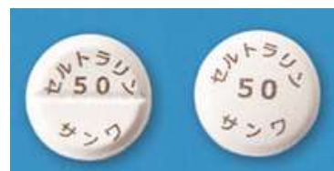
<セルトラリン錠 50 mg 「三和」>