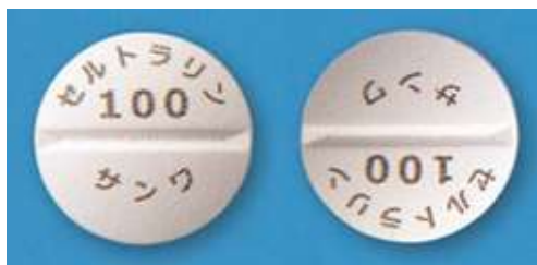
<セルトラリン錠 100 mg 「三和」>

※トレーサビリティとは、製品の製造、流通の過程を履歴として記録し、追跡可能である状態のこと。