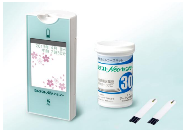
「グルテスト Neo アルファ」と「グルテスト Neo センサー」

加えて、測定した値を記録するだけにとどまらず、良好な血糖コントロールを目指す各種の機能を装備することで、患者さんと医療従事者の対話を深めることができる次世代を担う新しいタイプの製品です。